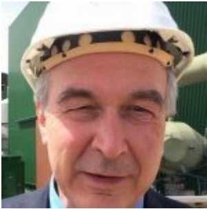
Montemaggi di EGP

centrali producono l'11% dell'elettricità geotermica della Toscana, ma ben il 28% delle emissioni di CO2 da quella fonte».